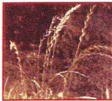
الحنيفة والرويفة Lolium spp.