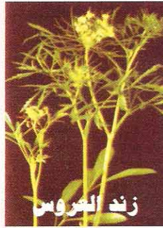
٣٠ غم / دونم