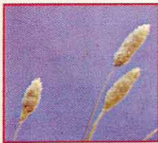
ذيل الثعلب Setaria spp.