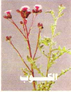
٣٠ غم / دونم