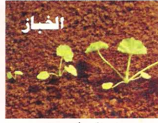
٤٠ غم / دونم