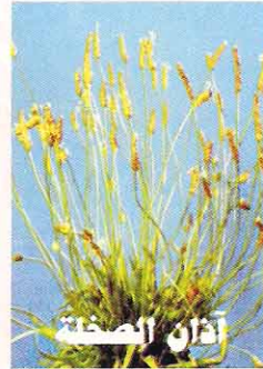
٣٠ غم / دونم