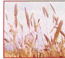
ذيل القط (أبودميم) Phalaris spp.