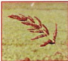
أبوركية، دخين، دنان Echinochloa crus-galli