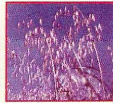
الشوفان البري Avena spp.