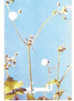
٣٠ غم / دونم