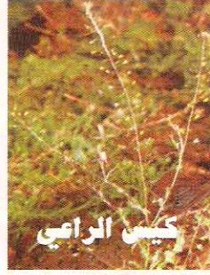
٣٠ غم / دونم