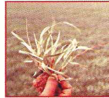
حشيش دجتاريا Digitaria sanguinalis