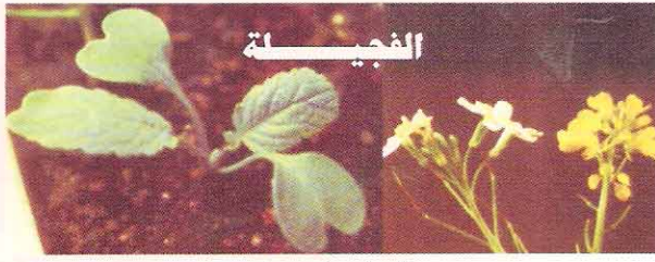
٣٠ غم / دونم

❖ يمتاز توبيك ولينتور بنسب إستخدام واطئة جداً مقارنة بمبيدات الأدغال الرفيعة والعريضة الأخرى ، مما يقلل تكاليف النقل والتخزين ويقلل أثر المادة المرشوشة في البيئة .