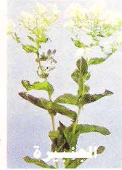
٣٠ غم / دونم