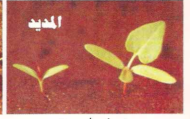
٤٠ غم / دونم