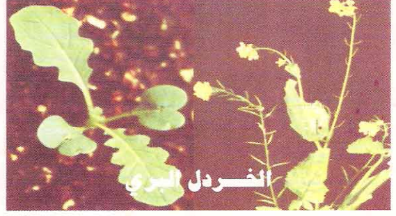
٣٠ غم / دونم